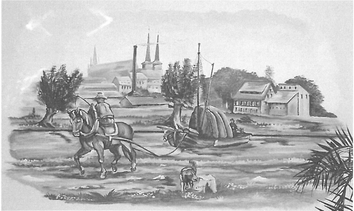
Wandbild von Hans J. Tempel, Apart Hotel Halle (Saale)